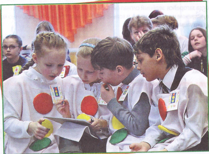
Фото Н. СЕРГОНОВОЙ, г. Можайск

Всегда носи специальные предметы со световозвращающими элементами, чтобы тебя было хорошо видно на дороге в тёмное время суток и в пасмурную погоду.